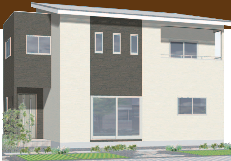
【16号地プラン】1階/50.51㎡(15.28坪) 2階/50.51㎡(15.28坪) 居住(延床)面積/101.02㎡(30.56坪)