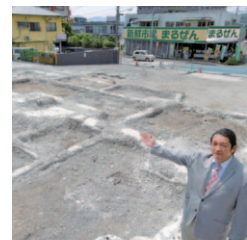
不動産業での厚い信頼は、幅広い知識と人脈があってこそ!

法律の専門家やゼネコンと連携しマンションの再建築を計画中の同社。「自然災害に強い」がキーワードです。中古流通の成約マンション価格等、勘案しながら査定する中古マンション販売も得意。来年2月、ゆめタウンサンビアン内に本社とモデルルームを予定中。