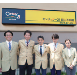
「お客様を一番に考えた最高のお手伝いを」同社専門スタッフ

世界有数の不動産ネットワーク「センチュリー21」加盟店の同社。地域に密着した視点で、売却の相談から引渡しまで、スピーディーに叶えます。「古いから」「間取りが悪いから」などの悩みもおまかせ! 売却・賃貸の両面から、最良の方法をご提案。気軽に相談を。