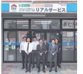
LIXILグループの全国ネットワークで不動産取引をサポート!

中央区、東区、菊陽・合志エリアの不動産を中心に扱う同社。地域の現状を熟知した宅建主任者が査定してくれます。宅建マイスター有資格者はもちろん、CFP・相続対策専門士も在籍し、税制・不動産投資にも精通。相続についての相談も受け付けています。