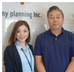
「誠実、正直さでお客様にとってbetterな提案を!」と雪見社長

熊本市内から熊本市近郊(合志・菊陽・益城・宇城)まで広域に対応。迅速な売却はもちろん賃貸借、自社での買取も含め様々な選択肢を提案。また「遊休資産有効活用事業」として、資産を活用すべき売却すべきかを具体的に提案。的確なアドバイスは定評があります!