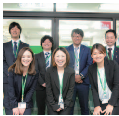
女性スタッフ常駐。熊本市に4店舗(米屋町、熊本中央、水前寺、八王寺)

全国ネットの豊富な情報量と、地域密着のきめ細かな対応で、県内の土地や新築・中古一戸建て、収益物件を数多く手掛けています。売買～賃貸管理まで各専門スタッフが様々な角度からの的確なアドバイス。売買と賃貸の同時査定も可能で、買取も積極的に行っています。