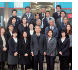
女性ならではの目線で、依頼者の要望に沿ったプランを提案

熊本市内はもちろん、福岡・佐賀・長崎・鹿児島と各地で不動産売買実績を積み上げてきた同社。女性スタッフも多く、住み替えサポートなどの細やかな対応に定評があります。急ぎの場合は、現金買取も可能。現在新築予定地急募につき、土地の買取強化中です。