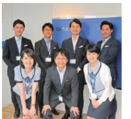
「土地売却後のお金を増やす運用法もお伝えします!」

住宅会社45社と提携しているから、高値での買取が可能! 販売のスピードも速い! 合志市・菊陽町・大津町は、特に買取強化中。田畑はもちろん、更地以外も丁寧に査定してくれます。不動産売買以外にも、保険や家計の見直しなど、ライフプランをトータルでサポート。