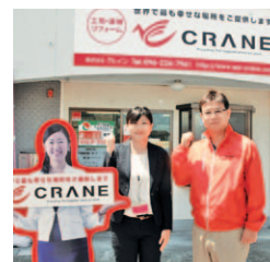
「元気なスタッフが全力で対応いたします!」

任意売却に関する事なら同社へ。住宅ローン滞納・競売問題・あらゆる借金問題に精通したスタッフが、様々な住宅に関する借金問題解決に向け、あなたに寄り添います。相談実績3000件以上、全国TV等、取材実績も多数。大切な「いえ」を残す方法も提案可能。