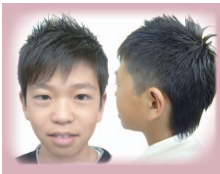
人気No.1のイケメンカットは、サイドの刈り上げなどアレンジも自在。親子で来店する人も多数

みんな待ち望んだ春の到来。身も心も髪型も軽やかにしましょう！チョコキチョコキ人気No.1のイケメンカットは、スッキリした短髪をベースに、前髪やトップに遊びをプラス。オシャレが気になる男子にも、カッコいい息子を待てるママにも評判です。また、定番のソフトモヒカンや