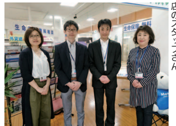
「ゆめあんしんプラザ」はまき店のスタッフさん

受験シーズンも終盤。春から、生活がガラリと変わる人も多いのでは？暮らしが変わると必要なことも変化します。長期間、保険を見直してない人は一度チェックを！アドバイスに納得すればその場で契約できますが、無理な契約は不要。まずは下記日程の無料相談へ。※要予約 営業/午前10時~午後8時