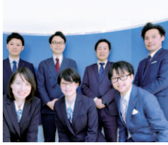
「土地売却後のお金を増やす運用法もお伝えします!」

53社もの住宅会社と提携しているから土地の高価買取が可能。田畑など更地以外でもスピーディーに対応できます。合志市・菊陽町・大津町は特に買取強化中。お金のプロ、FPが保険見直しや家計シミュレーションなど、ライフプランの相談にも無料で対応してくれますよ。