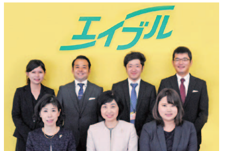
「女性が活躍できる不動産会社をモットーにしております」とスタッフ。女性目線の細やかなアドバイスも魅力!

店舗情報▶東区健軍2-11-56 ☎0120-345-787 http://www.kumamoto-j.biz/ 宅建業/熊本県知事免許(7)第3227号