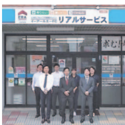
LIXILグループの全国ネットワークで不動産取引をサポート!

中央区、東区、菊陽・合志エリアの不動産を中心に扱う同社。地域の現状を熟知した宅建主任者が査定してくれます。宅建マイスター有資格者はもちろん、CFP・相続対策専門士も在籍し、税制・不動産投資にも精通。相続についての相談も受け付けています。