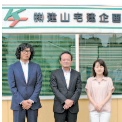
「お急ぎの方は3日で査定します。お気軽にご相談ください!」

地域に根差した実績と信頼で合志市を中心に菊陽町、北区などに管理物件や売買実績がある同社。物件の大小にかかわらず、土地や戸建、アパートなど収益物件の仲介や相続物件の活用方法の提案をしてくれます。買取も含めさまざまな選択肢が広がりますよ。