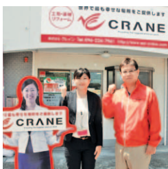
「元氣なスタッフが全力で対応いたします!」

中古住宅の売買、運用、リフォームまで経験豊富で、何よりもスタッフの丁寧な対応が評判。「頼んでよかった」の声がクチコミで広がり、お客様のほとんどが紹介、というほど。売却後までしっかりサポートしてくれます。ほか、住宅ローンの専門アドバイザーに相談OK。