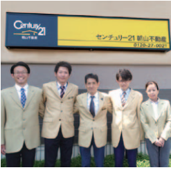
「お客様が一番に考えた最高のお手伝いを」同社専門スタッフ

世界有数の不動産ネットワーク「センチュリー21」加盟店の同社。地域に密着した視点で、売却の相談から引渡しまで、スピーディーに叶えます。「古いから」「間取りが悪いから」などの悩みもおまかせ! 売却・賃貸の両面から、最良の方法をご提案。気軽に相談を。