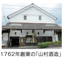
1762年創業の「山村酒造」

日本酒ファンならもちろんのこと、熊本人なら知らない人はいない、山村酒造の「れいざん」。辛口端麗ながらフルーティさも兼ね備えた、旨口の味わいに感動です。その理由は、高森町という、酒造りに最高の環境があったから。阿蘇から湧き出る新鮮でやわらかな水と、標高が高く寒冷な気候。そこで育まれる良質なお米。水・気候・米、そして伝統を守り続ける酒蔵の人あってこそ成せる、この場所だけの日本酒です。