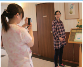
受付後はまず記念撮影。その写真が、それぞれのアルバムに貼付されます