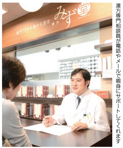
漢方専門相談員が電話やメールで親身にサポートしてくれます