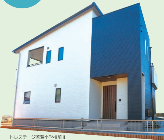
トレステージ若葉小学校前II 2号地モデルハウス (令和2年2月撮影)

2号地モデルハウス ■総額 3,598万円 (税込) ■土地/161.41㎡(48.82坪) ■建物/111.99㎡(33.87坪) ■建築確認番号/熊建第1191459号(令和元年11月11日) ■完成/令和2年2月 ■構造/木造2階建て