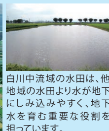
白川中流域の水田は、他地域の水田より水が地下にしみ込みやすく、地下水を育む重要な役割を担っています。