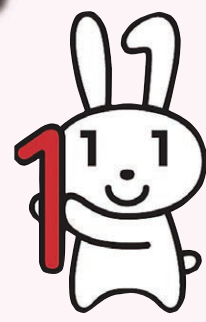
マイナンバー制度イメージキャラクター マイナちゃん

※マイナポイントの予約者数が上限に達した場合には、マイナポイントの予約を締め切る可能性があります。