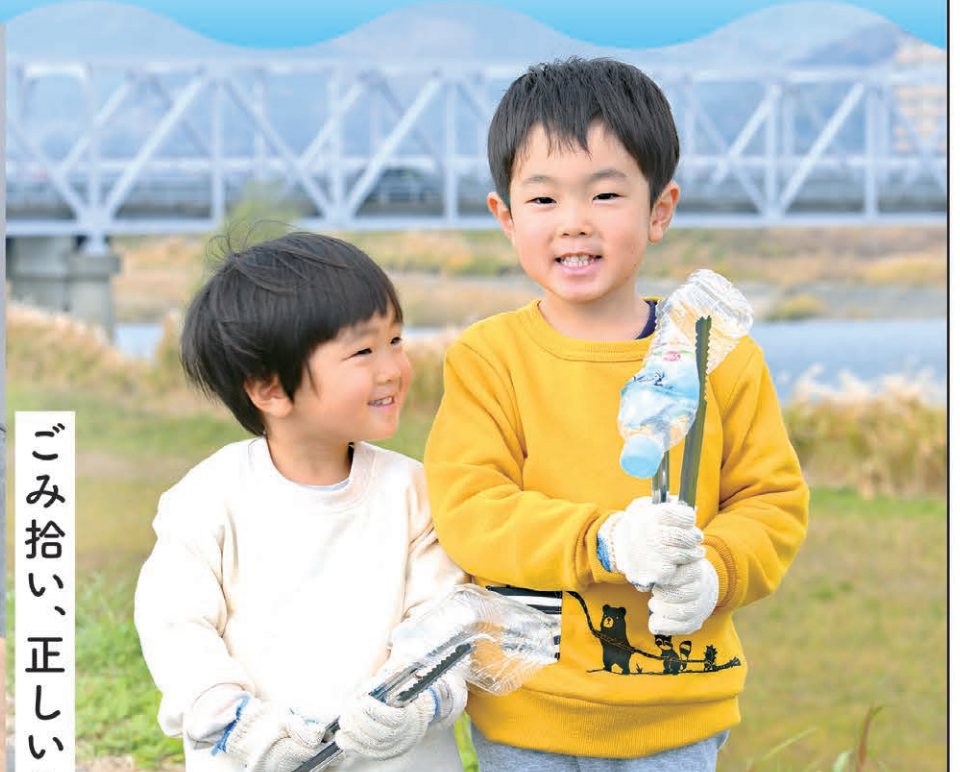
ごみ拾い、正しい分別、