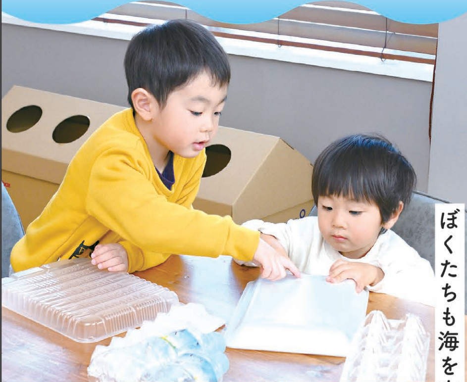
ぼくたちも海を守るよ。

道ばたにポイ捨てされたプラスチックごみは、風や雨によって川や水路に流れ込み、やがて海へと放出されます。「ポイ捨てをしない」「ごみを減らす」「ごみを拾う」ちょっとした行動が環境改善につながっていきます。