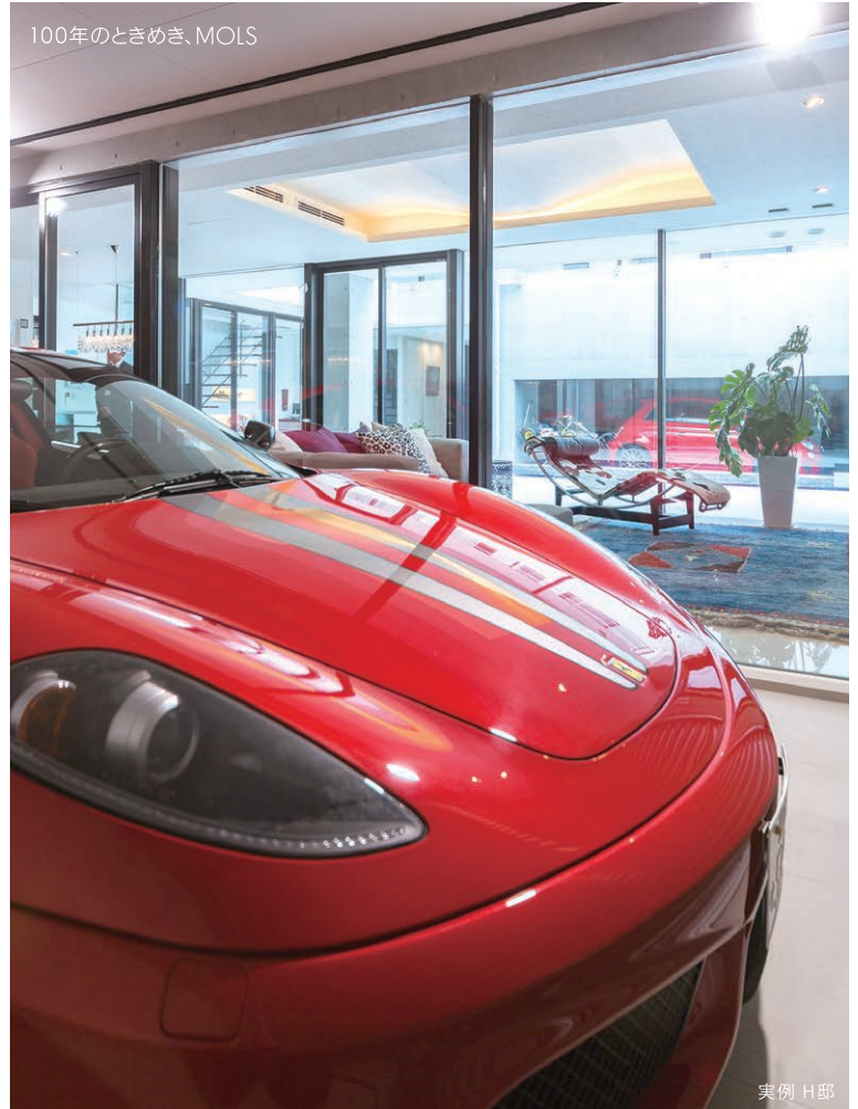
事例1 愛車に酔える、ビルトインガレージ 車の魅力を引き出せるよう空間を自由にデザインし、美術品のように愛車を守る特別なビルトインガレージ。自宅でも自分の好きな車を最大限に楽しめる空間づくりを叶えられました