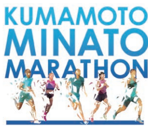
※ポスターイメージ 後援/熊本県、熊本市教育委員会、熊本日日新聞社、RKK、KKT、KAB、TKU、FMK、FM791他

熊本港を会場としたマ ラソン大会が11月21日 (日)に開催。それに伴い、 ボランティアを現在募集 しています! 活動内容としては、ラ ンナー受付準備、給水ポ イント準備と配置、コー ス整理、入場口や退場口 への誘導、会場内案内な ど。参加者には、イベン ト会場で使えるクーポン がもらえます。希望者は 早めに申込みを↓下記。 問合せ/熊本みなとマラ ソン実行委員会事務局