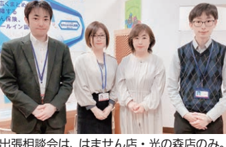
出張相談会は、はまません店・光の森店のみ。※地区により対応できない場合があります