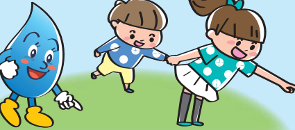
メーターボックス