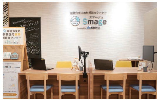
アクセス便利な街なか、COCOSA5階にある相談カウンター