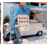
天泣(ホットサンド)