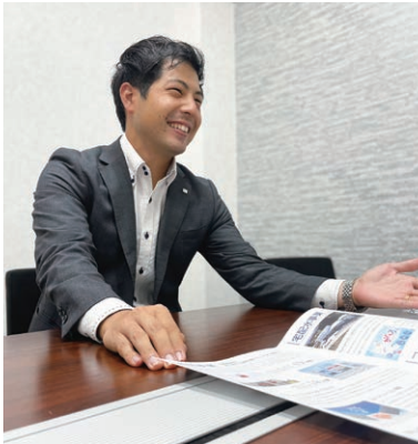
県庁通り支店内観。プライベートな話も落ち着いて相談できる全個室対応です

「安心」できる不動産取引 「家づくり何から始める? そんな時こそ」 地元で詳しい住まいのコンサルタントが、中立的な立場で家づくりを1からサポート。紹介時に住宅会社 「方・希望を叶える方法... 疑問や悩みを無料で何でも相談にのってもらえます。」「南区白藤周辺など、未公開の土地情報もご案内できます。納得できる家づくりを目指しましょう」とスタッフ。予約の上、来店を。 「家づくり何から始める? そんな時こそ」 地元で詳しい住まいのコンサルタントが、中立的な立場で家づくりを1からサポート。紹介時に住宅会社 「方・希望を叶える方法... 疑問や悩みを無料で何でも相談にのってもらえます。」「南区白藤周辺など、未公開の土地情報もご案内できます。納得できる家づくりを目指しましょう」とスタッフ。予約の上、来店を。