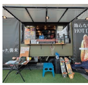
JinXJin(馬肉ホットドッグ)