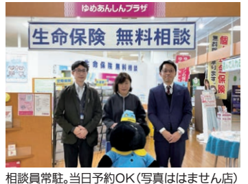
相談員常駐。当日予約OK(写真ははません店)

物価高で毎日の節約も限界。家計防衛のため、保険から見直してみよう。必要な保障は確保しムダを削ってシヤストな保険に。お金の話に苦手意識がある人こそ、プロの知恵に頼ってほしい。 相談会は、5月10日(水)〜5月27日(土)。時間は午前10時、正午、午後2時、4時、6時。3店同時・毎日開催。 ※無料・要予約。 営業/午前10時〜午後8時