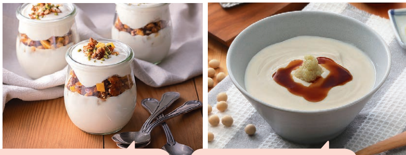
+ドライフルーツでスイーツに